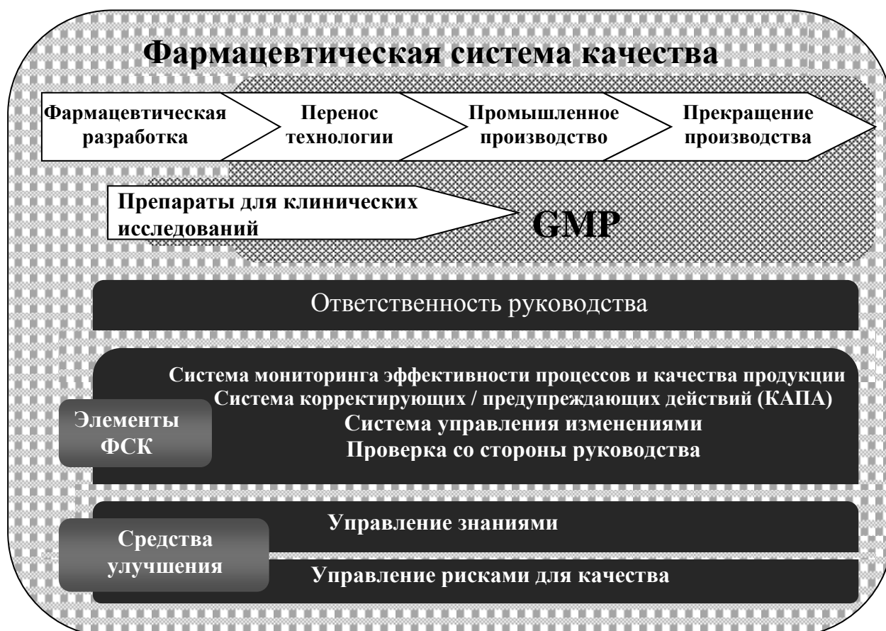
СХЕМА МОДЕЛИ ФАРМАЦЕВТИЧЕСКОЙ СИСТЕМЫ КАЧЕСТВА В СООТВЕТСТВИИ С НАСТОЯЩИМ ДОКУМЕНТОМ

На представленной схеме показаны основные особенности модели фармацевтической системы качества (ФСК). Фармацевтическая система качества охватывает весь жизненный цикл продукции, включая фармацевтическую разработку, перенос технологии, промышленное производство и прекращение производства, как показано в верхней части схемы. Фармацевтическая система качества расширяет требования настоящих Правил, как показано на схеме. Схема также показывает то, что требования настоящих Правил распространяются на производство лекарственных препаратов для клинических исследований.